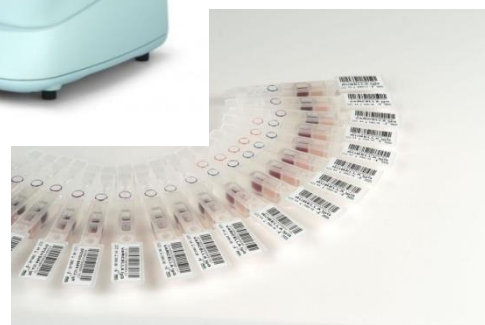
PCK – реакция связывания компонента